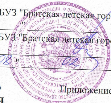
ГРАФИК СМЕННОСТИ РАБОТНИКОВ ОБЛАСТНОГО ГОСУДАРСТВЕННОГО БЮДЖЕТНОГО УЧРЕЖДЕНИЯ ЗДРАВООХРАНЕНИЯ "БРАТСКАЯ ДЕТСКАЯ ГОРОДСКАЯ БОЛЬНИЦА"